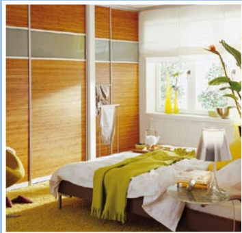
Kleiderkammer: clever gelöst