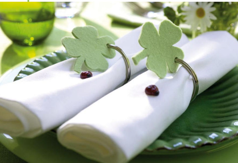
▲ In der Natur eine Rarität – auf dem Esstisch gleich serienweise: Vierblättrige Kleeblätter, mithilfe einer Schablone auf grünen Filz übertragen, dann ausgeschnitten und gelocht, zieren hier große Schlüsselringe, die aufgerollte Servietten (V & B) zusammenhalten

Bezugsquellen Seite 56