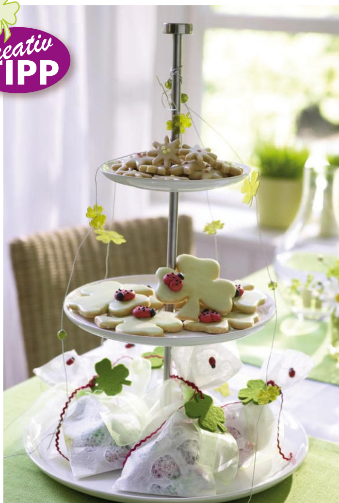
▲ Kleeblätter als Dekoration und Gebäck – wenn das kein Glück bringt! Die Etagere (Höhe 49 cm, 39,90 € plus Versand, Asa Selection, Tel. 02624/189 36, www.asa-selection.com) schmückt sich mit selbst gemachten Girlanden: die eine aus Draht, Perlen und (Kunststoff-) Blättern, die andere aus roter Litze (Halbach) und grünem Filz

Bezugsquellen Seite 56