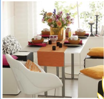
Flexible Möbel: mehr Platz